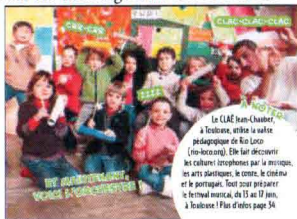
La CLAE Jean Guadet, à Toulouse, offre la suite pédagogique de Rio Loco (en français). Elle fait découvrir les cultures lusophones par la musique, les arts plastiques, le conte, le cinéma et le potager. Tout pour préparer le festival musical, du 13 au 17 juin, à Toulouse ! Plus d'infos page 54